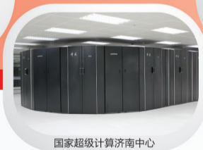
国家超级计算济南中心