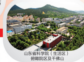
山东省科学院(生活区)俯瞰图及千佛山