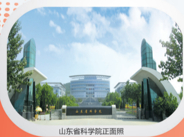
山东省科学院正门照